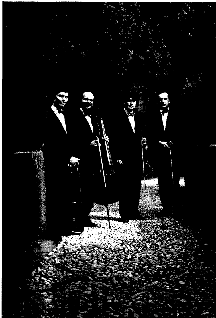
CUARTETO DE CUERDA SILVESTRI