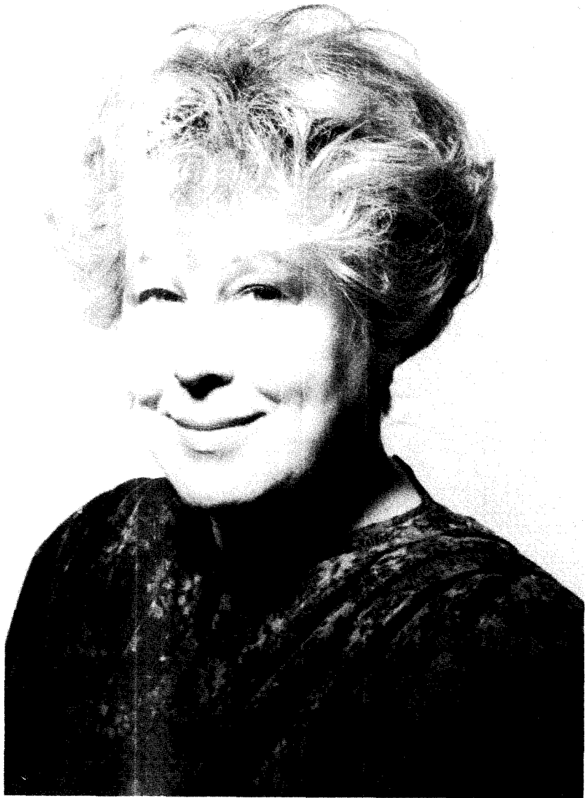
GUNDULA JANOWITZ, soprano