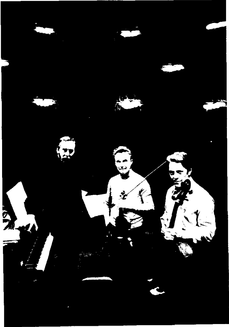
TRIO DE TRIESTE